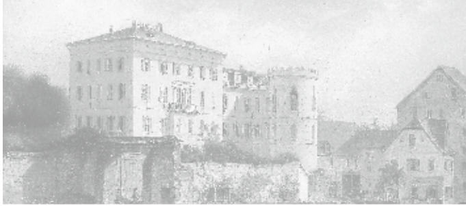
Haus Metzler in Bonames auf einem Gemälde von Carl Morgenstern, 1865