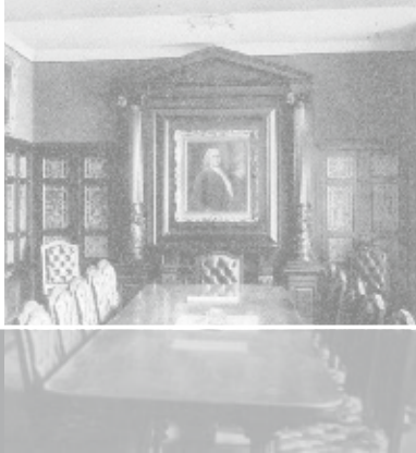
Sitzungssaal im Bankhaus Metzler um 1900